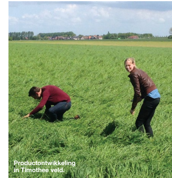
Productontwikkeling in Timothee veld.

lijk niet vol, hij wordt als het ware onder de voet gelopen. Voor Pavo Nature's Best wordt in de provincie Zeeland speciaal Timothee verbouwd. De Timothee wordt in de zomer gemaaid als het volop in bloei staat. Vervolgens wordt het na het droogproces met stengel en al in een brokje geperst (en dus niet eerst gemalen). Daarbij blijft de structuur zoveel mogelijk bewaard. Op deze manier wordt het kauwen van de paarden gestimuleerd, wat leidt tot meer speekselproductie. Die is nodig voor een goede verttering en het voorkomen van maagzweren.